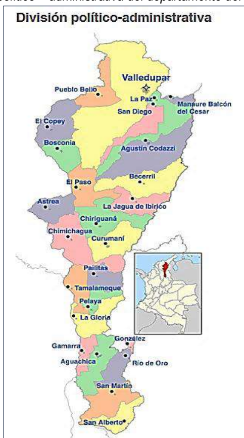
Figura 1. Mapa de la división político – administrativa del departamento del Cesar 1